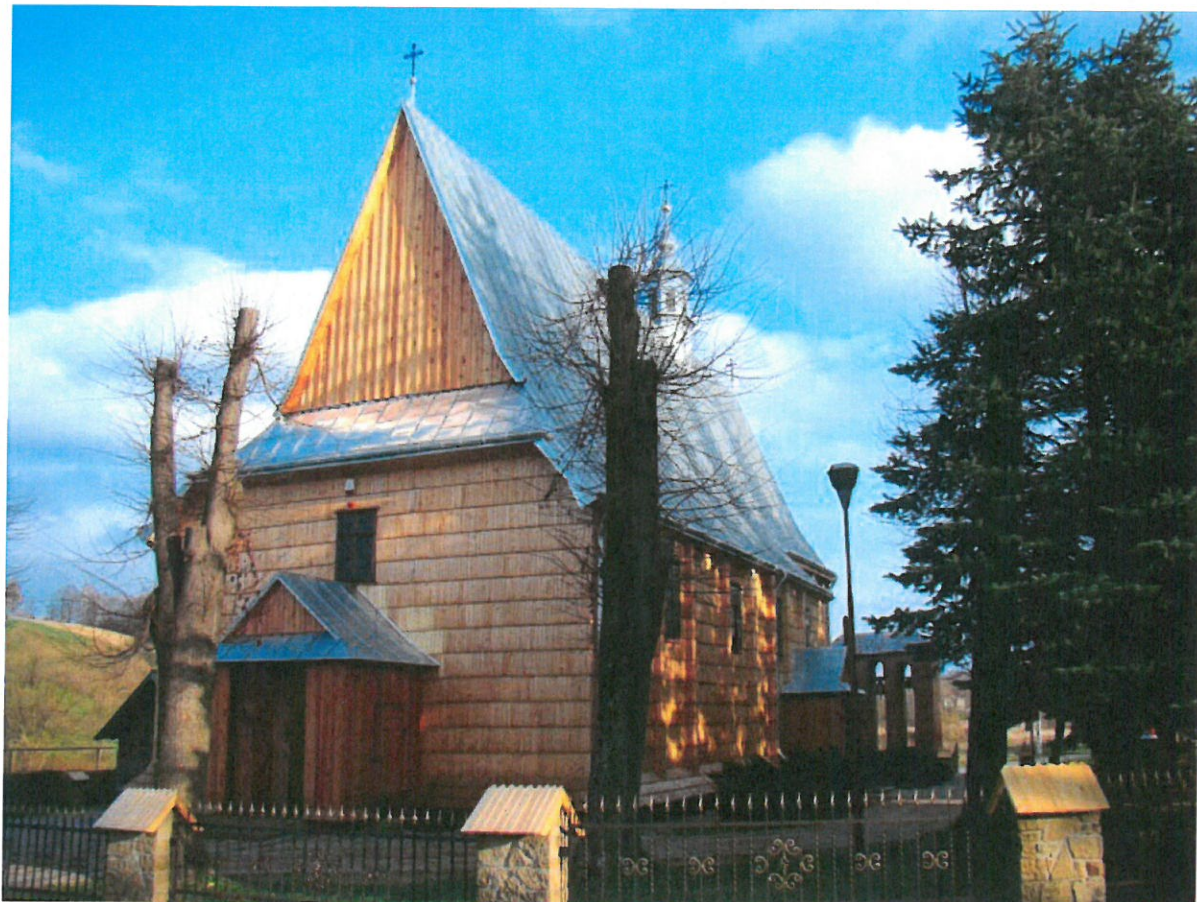
Widok drewnianego zabytkowego Kościoła Parafialnego w Golcovej