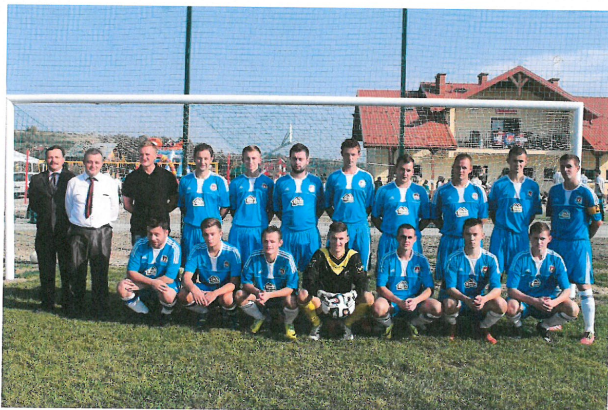
Drużyna i działacze LKS Golcowa (sezon 2014/2015)