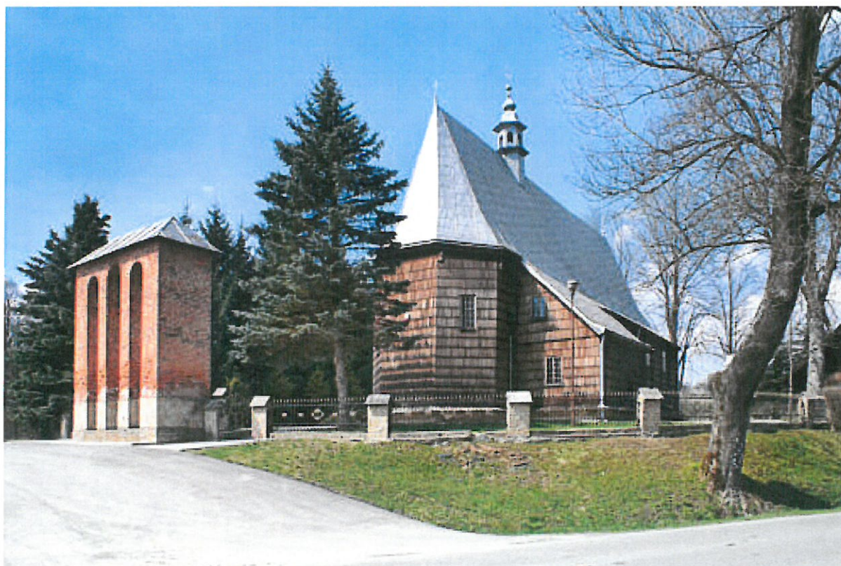
Widok drewnianego zabytkowego Kościoła Parafialnego w Golcovej

We wsi znajduje się kościół parafialny pw. św. Barbary i Narodzenia NMP wzniesiony zapewne w II poł. XV w. Wybudowany w systemie więźbowo-zaskrzynieniowo-zaczepowym, należącym do najstarszych typów konstrukcyjnych kościołów drewnianych. W II poł. XIX w., przebudowany (m.in. rozebrano soboty, wybudowano wieżyczkę na sygnaturkę, przedłużono nawę, wewnątrz korpusu podzielono na trzy nawy). Wnętrze pokryte jest polichromią z XIX w., pędzla Jana Babińskiego. Kościół należy do najstarszych obiektów późnogotyckiej architektury drewnianej na Podkarpaciu.