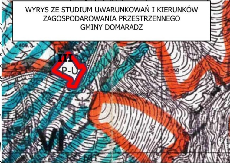
P-U GRANICA OBSZARU OBJĘTEGO MPZP „DOMARADZ 1/2022”

KIERUNKI ZAGOSPODAROWANIA OBSZARÓW W STREFACH FUNKCYJNALNYCH ZE WSKAZANIEM ISTNIEJĄCEGO I MOŻLIWEGO WYKORZYSTANIA (PRZEZNACZENIA) TERENU I PODZIAŁEM NA FUNKCJE