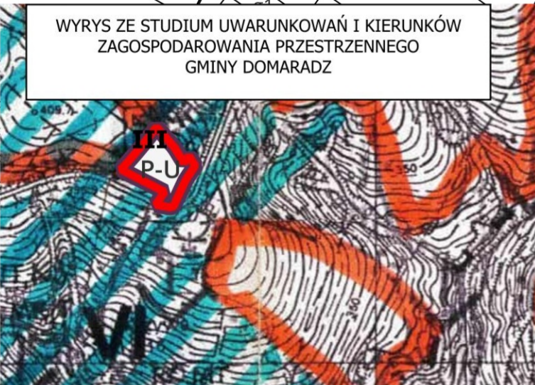
P-U GRANICA OBSZARU OBJĘTEGO MPZP „DOMARADZ 1/2022”

KIERUNKI ZAGOSPODAROWANIA OBSZARÓW W STREFACH FUNKCYONALNYCH ZE WSKAZANIEM ISTNIEJĄCEGO I MOŻLIWEGO WYKORZYSTANIA (PRZEZNACZENIA) TERENU I PODZIAŁEM NA FUNKCJE